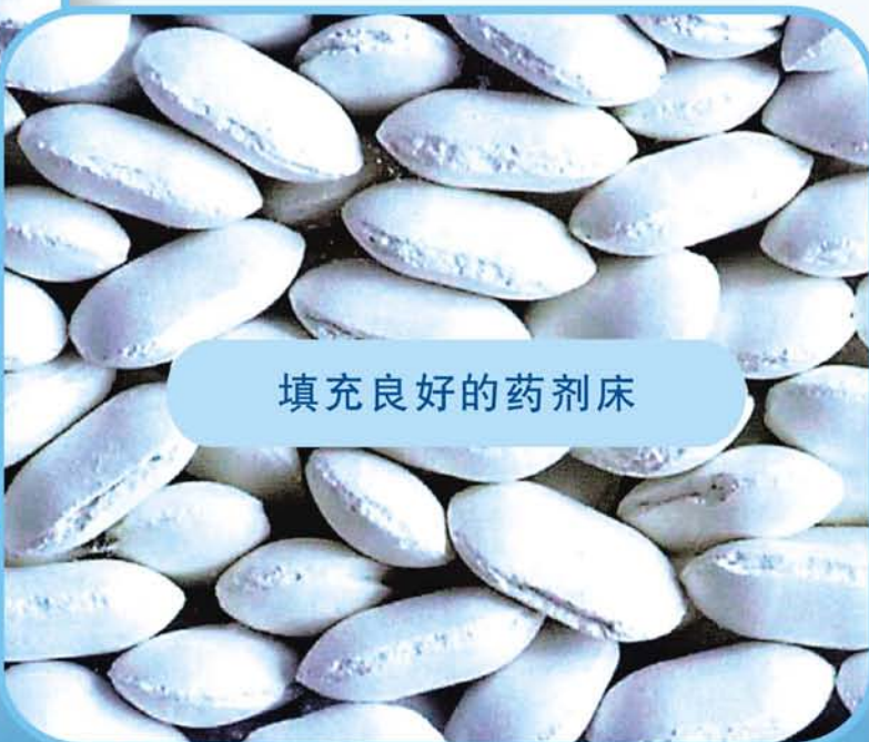
填充良好的药剂床